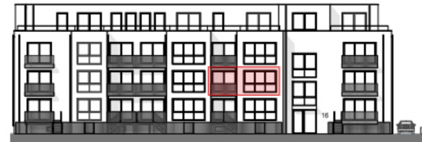
Ansicht West - Straßenseite "Am Bramhoff" -