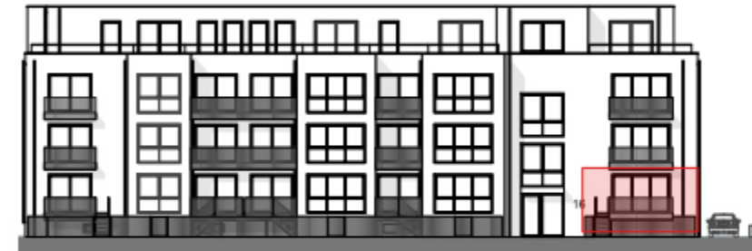
Ansicht West - Straßenseite "Am Bramhoff" -